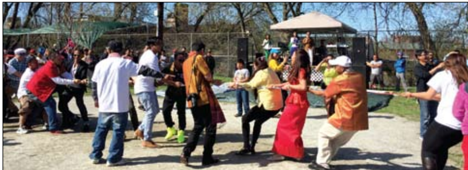
Cambodian traditional game "Tugs of War" was being played at the Clemente Park during a Cambodian New Year celebration in April 2016.