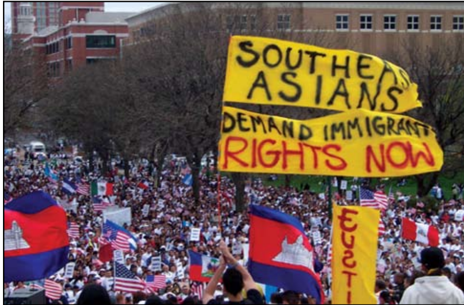
Protesters demand for the immigration rights in responding to ICE raids on Cambodian communities at a 2013 demonstration .

ខ្មែរត្រូវបានបញ្ជូនទៅកាន់ប្រទេសកម្ពុជា ប៉ុន្តែមានករណីជាច្រើនទៀតប្រហែលជាង ១.៩០០ ករណី រដ្ឋាភិបាលអាមេរិកមិនមានការចាត់វិធាននៅក្នុងករណីមិនទាន់មានចំណាត់ការពីរដ្ឋាភិបាលបានកំពុងរស់នៅដោយសុខសាន្តនៅក្នុងសហគមន៍របស់ពួកគេ និងនៅតែមិនមានទោសព្រោះនៅក្នុងករណីមិនទាន់មានចំណាត់ការពីរដ្ឋាភិបាលបានកំពុងរស់នៅដោយសុខសាន្តនៅក្នុងសហគមន៍របស់ពួកគេ និងនៅតែមិនមានទោសព្រោះ