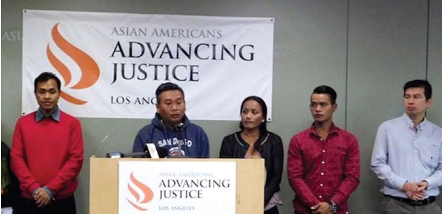
Nonprofits sue over immigration detention of Cambodian nationals who came as refu-gees

ភៀសខ្លួនដែលបានរត់គិចចេញពីរបបខ្មែរក្រហម ដែលជាប់សំណាប់ប្រជាជនខ្មែរច្រើនជាង២លាននាក់ក្នុងរង្វង់ឆ្នាំ១៩៧៥-១៩៧៩ ។