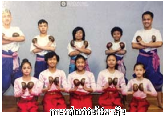
ក្រុមរបាំយុវជនវិជ្ជាភ្នំ

នៅថ្ងៃទី២០ ខែមេសា ២០១៩ ម៉ោង៨-១១ព្រឹកជួបជុំពុទ្ធបរិស័ទធ្វើកិច្ចនសម្បការព្រះរតនត្រ័យនិមន្តព្រះសង្ឃចំរើន ព្រះបរិត្ត បង្កកូល - រាប់បាត - ប្រគេនចង្កាន់ ព្រះសង្ឃ ម៉ោង១២ថ្ងៃ ការសម្តែងរបាំបុរាណខ្មែរដោយក្រុមសិស្សសមាគមខ្មែរ