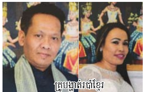
គ្រូបង្ហាត់របាំខ្មែរ

ពលរដ្ឋ មានវត្តសំខាន់ៗដូចជាវត្ត"ធម្មិកាភាម" និងវត្ត"ពុទ្ធមណ្ឌល"ជាដើម ដូច្នេះគឺជាទីប្រមូលផ្តុំប្រជាពលរដ្ឋមានសញ្ជាតិនិងវប្បធម៌ដូចគ្នាបានយ៉ាងពេញមុខនឹងសុខសាន្ត លើសពីនេះទៅទៀតនោះ ប្រវិជនសម្បូរការងារធ្វើសម្រាប់អ្នក