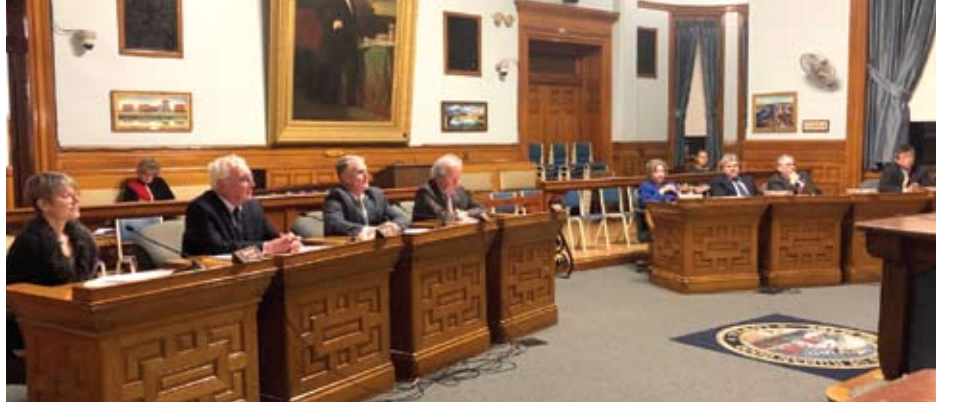
Lowell City Council Meeting Tuesday, March 19, 2019