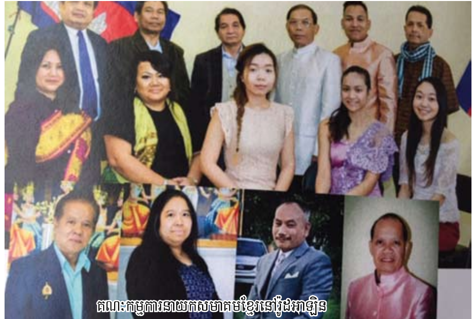
គណៈកម្មការនាយកសមាគមខ្មែរនៅរដ្ឋអាឡិន

នឹងវាតទី រុញតុ រុញកៅអីចេញ ដើម្បីធ្វើឱ្យក្លាយទៅជាសាលហាត់របាំដ៏ទូលាយសម្រាប់កុមារៗមកហាត់សម្តែងរបាំរបស់ខ្លួន នាពេលបន្ទាប់ក្លាមនោះទេ ។ កុមារាកុមារីជាច្រើនសិល្បករខ្មែរ បានត្រូវមាតាបិតានាំមកឱ្យហាត់រៀនរបាំជាវប្បធម៌ដូនតារបស់ខ្លួន ឱ្យនៅតែជាមរតកប្រចាំជំនាន់ខ្មែរ ជំនួសឱ្យអ្នកដែលរស់ខ្លាំងមិនបាននាំកូនចៅមកហាត់រៀន ។