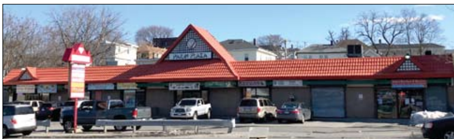
Pailin Plaza on Middlesex Street across from the Clemente Park