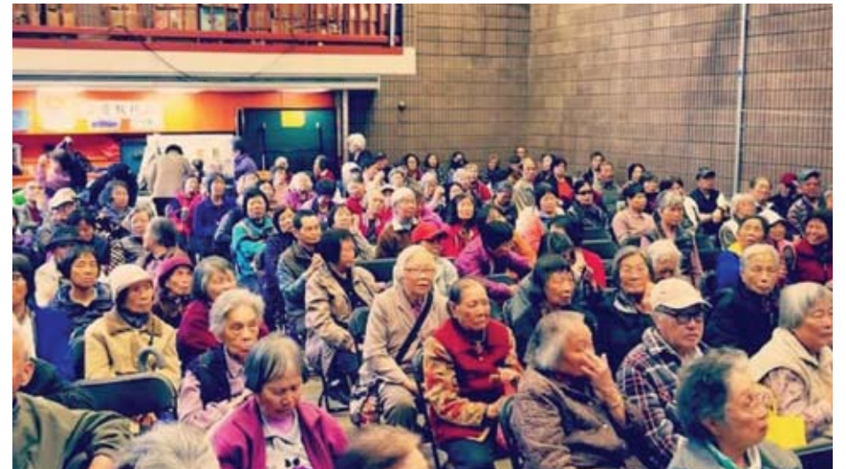
San Francisco residents attended a forum to learn how to protect themselves from the immigration enforcement.

ទោះបីយ៉ាងណាក៏ដោយវិធានការថ្មីនៃការអនុវត្តន៍បទសេចក្ដីបង្គាប់នៃការបណ្ដេញចេញដែលត្រូវបានចេញជាច្រើនឆ្នាំមកហើយ