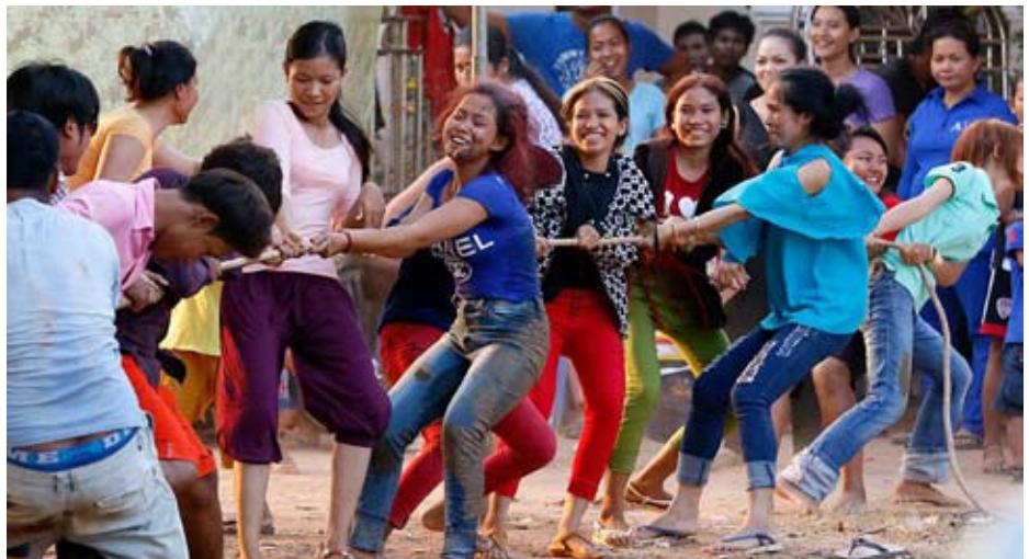
ល្បែងទាញព្រីត្រ

ខ្មែររស់មមាញឹកនិងរហកសិកម្ម មានស្រែចម្ការជាដើម ទើបលោកលើកកំណត់ពេលចូលឆ្នាំមកធ្វើនៅខែចេត្រវិញ ដោយហេតុថា ខែចេត្រកិច្ចការច្រូតការបោកបែន បានចប់សព្វគ្រប់ ហើយប្រជាពលរដ្ឋខ្មែរទំនេរ មានឱកាសធ្វើបុណ្យទានកម្សាន្តសប្បាយតាមប្រាថ្នា។