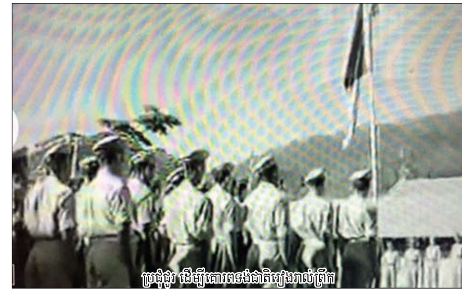
ប្រជុំផ្លូវ ដើម្បីគោរពទង់ជាតិរៀងរាល់ព្រឹក

ភាគ១ - សាលាកងកុមារយោធិន្ន តពីលេខមុន នាងច្រៀងថា...វាលវែងឆ្ងាយ!... សិស្ស កុមារយោ ធិន្នតែងនាំគ្នាបន្ទូលថា "វែកឆា! វែក ឆា!" ធ្វើឱ្យស្រែតកូស៊ីនខឹងសម្បារជាខ្លាំង ដោយ "វែក ឆា" បានក្លាយជាងាររបស់គាត់ ពីព្រោះ ឆារ នោងសាច់ជ្រូក-នុំប៉ុនទឹកដោះគោខាប់ -ខ្លះក៏ចូលចិត្តបាយក្តាំងលាបទឹកចំណុះខ្លាញ់ លាយស្លឹក ខ្លឹម ដែលជាម្ហូបក្រៅស្តុកទៅវិញ... តែពុំដែលពួកមានការពុលម្ហូបអាហាររួមម្តង ណានោះ ទេ ។ សិស្សតូចៗ ពេលចូលរោងបាយ មានអាកប្បកិរិយាច្រងេងច្រងាងបន្តិចមែន