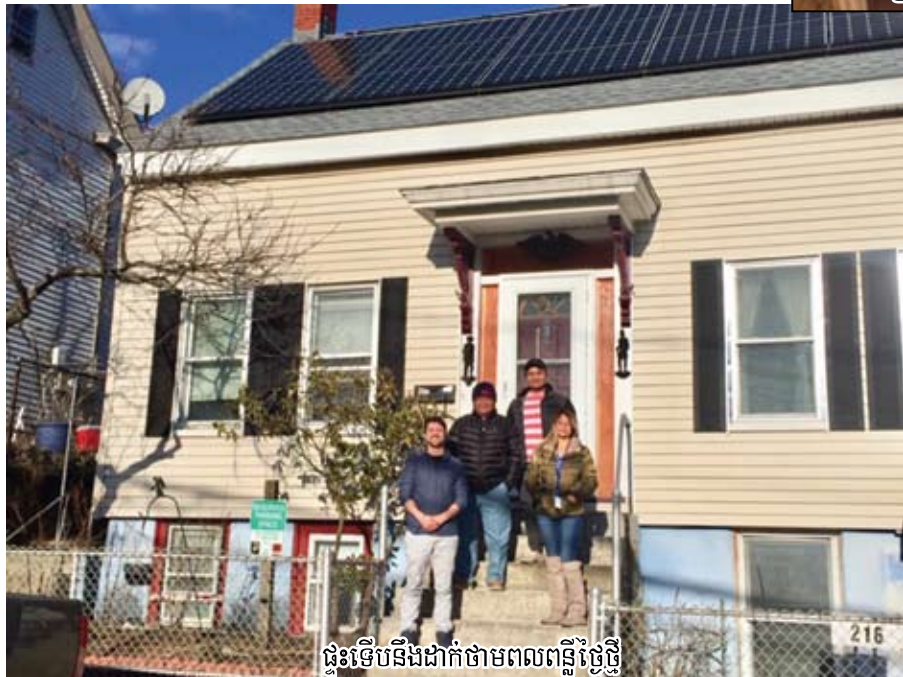
ផ្ទះទើបនឹងដាក់ថាមពលពន្លឺថ្ងៃថ្មី