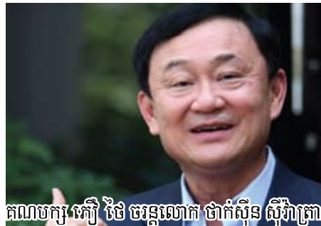
គណបក្ស ភឺឡី ថៃ ចាន់ណាត ថាក់ស៊ីន ស៊ីវាត្រា

ឆ្នោតក៏បានដៃឱ្យតែមានលក្ខណៈសម្បត្តិគ្រប់គ្រាន់...។ គួររំលឹកថា អាសនៈ២៥០របស់ព្រឹទ្ធសភាយោងតាមធម្មនុញ្ញថ្មី គឺក្រុមយោធាជាអ្នកតែងតាំងទាំងអស់, បន្ថែមពីនោះទៀត គេដឹងថា ដើម្បីឱ្យបាន