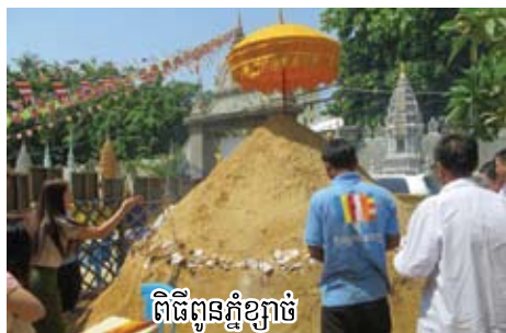
ពិធីពុទ្ធកិច្ចខ្មែរ

រាំងស្ងួត ហើយបើចោលក្នុងមហាសមុទ្រ ទឹកនឹងរីង ស្ងួតហួតអស់ ដូច្នេះសូមឱ្យបុត្រីទាំង៧អង្គយកពាន មកទទួលព្រះសិរសាបិតា"។ ចាំហើយក៏កាត់ព្រះ