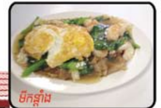
មីកន្តាំង