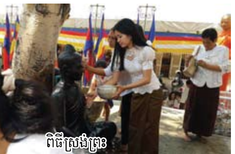
ពិធីស្រង់ព្រះ

អករណៈ: ១: បើសង្ក្រាន្តជាថ្ងៃអាទិត្យ ទេពធំៗព្រះនាម "ព្រះនាងទុង្សទេវី" ស្លៀកខ្លាច់មី ត្រឡប់ប្រដាប់