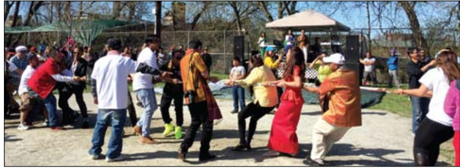
Cambodian traditional game "Tugs of War" was being played at the Clemente Park during a Cambodian New Year celebration in April 2016.

និងមោទនភាពថ្មីដែលមានឧទ្យានត្រូវបានដាក់ ១៩៩០ ។ ឈ្មោះជាថ្មី នៅទីតាំងបណ្តុំទៅដោយវប្បធម៌ ដែល ឧទ្យានរ៉ូប៊ីន ក្រូមីនតេផាក ធ្លាប់ជាទីលាន