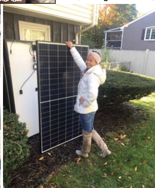
ទ្រទៀតផង ។

គ្មានយកប្រាក់ពិសេស មានការលើកពន្ធផ្តងជាក់ច្រៃ ច្រើនពាន់ដុល្លារផង ។ លោក ឆលី យី គ្រួសារខ្មែរម្នាក់ នៅផ្លូវ “ស្លូល”