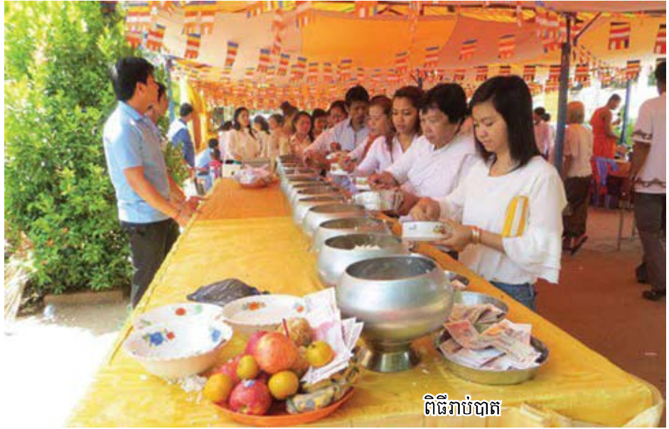
ពិធីរាប់បាត

ថ្ងៃត្រង់សិរសាបូជានៅលើទ្រូង ហេតុនោះ ទើបមនុស្ស ត្រូវយកទឹកលាងទ្រូង, ខ្លះទី៣ ពេលល្ងាចសិរសាបូជានៅ លើជើង ហេតុនោះ ទើបមនុស្សទាំងឡាយត្រូវយកទឹក លាងជើង"។