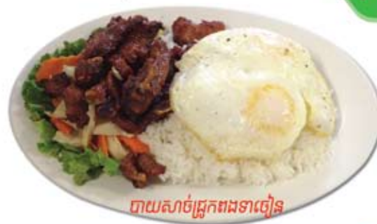
បាយសាច់ជ្រូកពងទាញ់