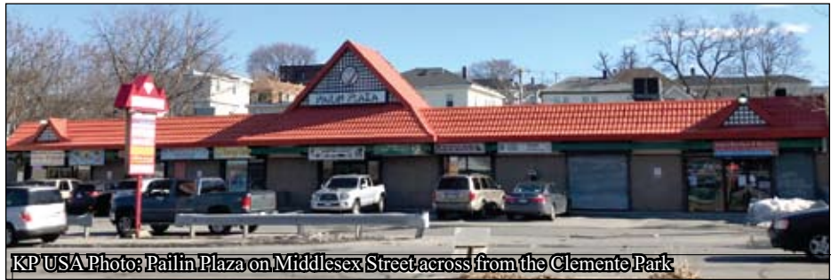
Pailin Plaza on Middlesex Street across from the Clemente Park

នៅឯកិច្ចប្រជុំ ក្រុមប្រឹក្សាសាលាក្រុងកាលពី ថ្ងៃទី ១៩ ខែមិថុនា អនុគណៈកម្មាការទីលានកំសាន្ត និងឧទ្យាន បានជូបជុំគ្នា និងសម្រេចគាំទ្រចំពោះ ការប្តូរឈ្មោះឧទ្យាននេះ។ ក្រុមប្រឹក្សាក្រុងបាន យោងសំណើរបស់លោក អ៊ីល្យេត ទៅកាន់ក្រុម ប្រឹក្សាឧទ្យាន ហើយការបោះឆ្នោតចុងបញ្ចប់ និង ត្រូវធ្វើឡើងនៅកំឡុងពេលខែមេសានេះ។ ជាមួយ នឹងការត្រួតពិនិត្យចុងបញ្ចប់ប្រពៃណីខ្មែរជារៀង រាល់ឆ្នាំដែលប្រព្រឹត្តទៅនៅឯស្ថានឧទ្យាននេះសម្រាប់ ថ្ងៃទី២០ ខែមេសាឆ្នាំនេះសហគមន៍ខ្មែរក្រុងឡូរែល អាចនឹងមានឱកាសក្នុងការរៀបចំចូលរួមជាមួយ