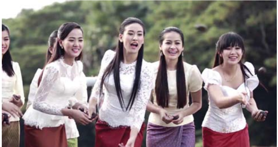
ល្បែងបោះអង្គព្រំ

អករណៈ: ១: បើសង្ក្រាន្តជាថ្ងៃអាទិត្យ ទេពធំៗព្រះនាម "ព្រះនាងទុង្សទេវី" ស្លៀកខ្លាច់មី ត្រឡប់ប្រដាប់