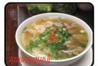
ស៊ុយមស្រូវ