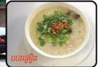
បបរស្រូវ