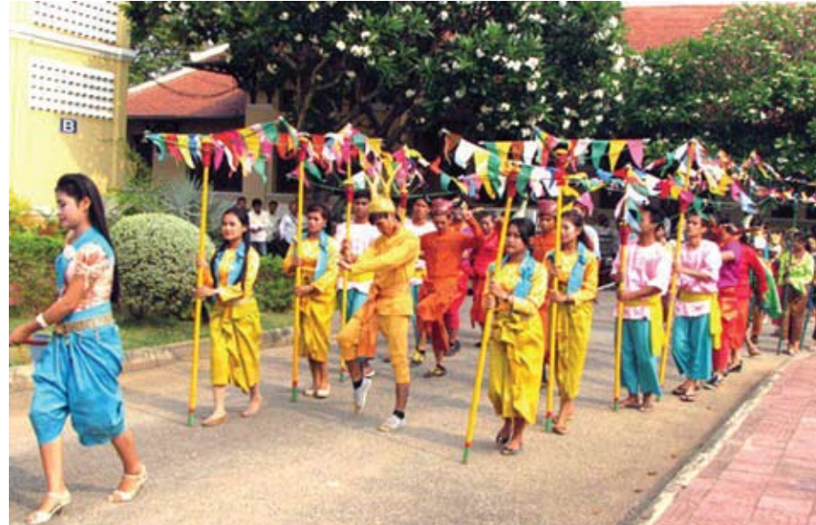
ស្វែងប្រជាប្រិយត្រុដិ

ត្រង់ចំណីក្បាល)។ គេនៅប្រើចន្ទគតិឯបុគ្គលិកសុរិយគតិដែរ ព្រោះចន្ទគតិមានទំនាក់ទំនងនឹងពុទ្ធបុព្វត្តិ