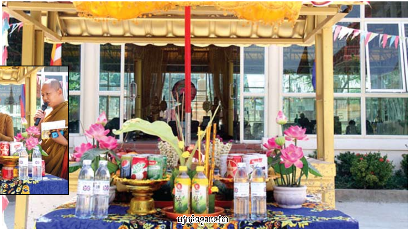
រៀបចំទទួលទេវតា

"អនុមោទនា ទទួលយកមកក្សរផលកុសលនៃ"ពិធីបុណ្យ ចូលឆ្នាំកុរ"២៥៦៣នៃពុទ្ធសករាជ្យត្រូវនឹងឆ្នាំ២០១៩ នៃគ្រឹស្តសករាជ្យ ចាប់ពីពេលនេះទៅ" ឱ្យបានគ្រប់ៗ គ្នា ដែលនោះហើយជាវត្ថុបំណងរបស់"កបិលមហា ប្រាហ្ម" ក្នុងព្រះរាជដំណើរជុំវិញពិភពលោក ១ឆ្នាំម្តង