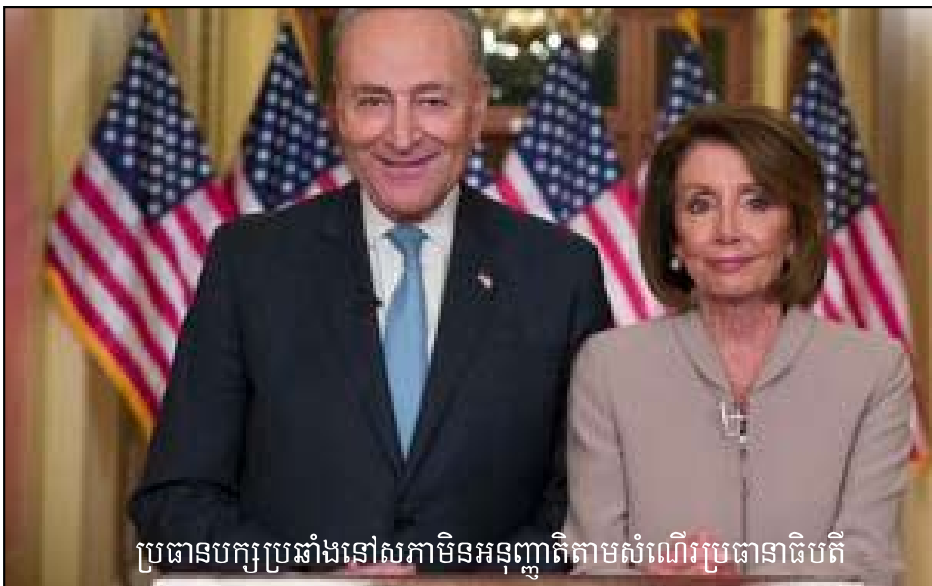
ប្រធានបក្សប្រឆាំងនៅសភាមិនអនុញ្ញាតតាមសំណើរប្រធានាធិបតី