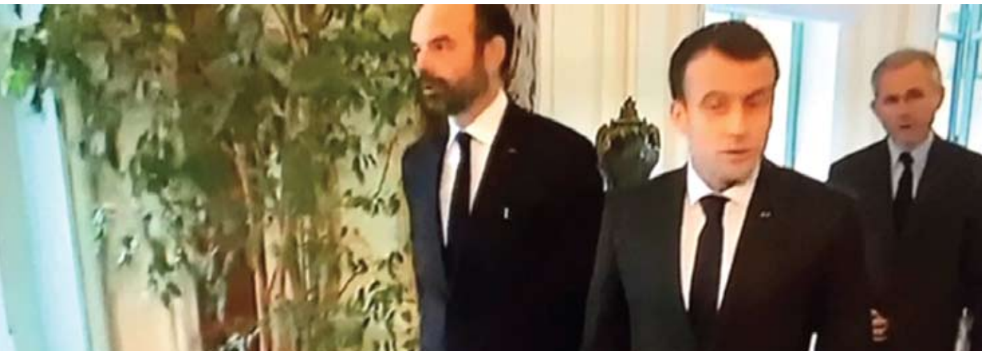
នាយករដ្ឋមន្ត្រី និងប្រធានាធិបតីបារាំងចេញពីប្រជុំដោះស្រាយវិបត្តិ

តាមពិតទៅតាំងតែពីលោកប្រធានាធិបតីម៉ាក្រុង បានជាប់ឆ្នោតកាលពី១៨ខែមុនមក ស្ថានភាពនយោបាយប្រទេសបារាំង មិនដែលបានជា