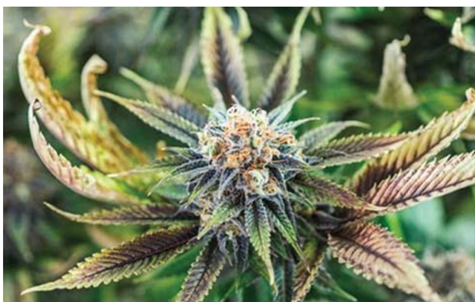
ដើមកញ្ឆា

ការរបស់ខ្លួនមួយទៀត Sub-committee of cannabis ដែលគេជាអ្នករកកន្លែងឱ្យសមរម្យ ក្នុងក្រុង ដែលអនុញ្ញាតឱ្យមាន...” វាសនា នួន: សាលាក្រុងនឹងយកពន្ធនា% លើប្រាក់ចំណូលប្រចាំឆ្នាំនៃពាណិជ្ជកម្មនោះ សម្រាប់ទៅទំព័រទី១៨