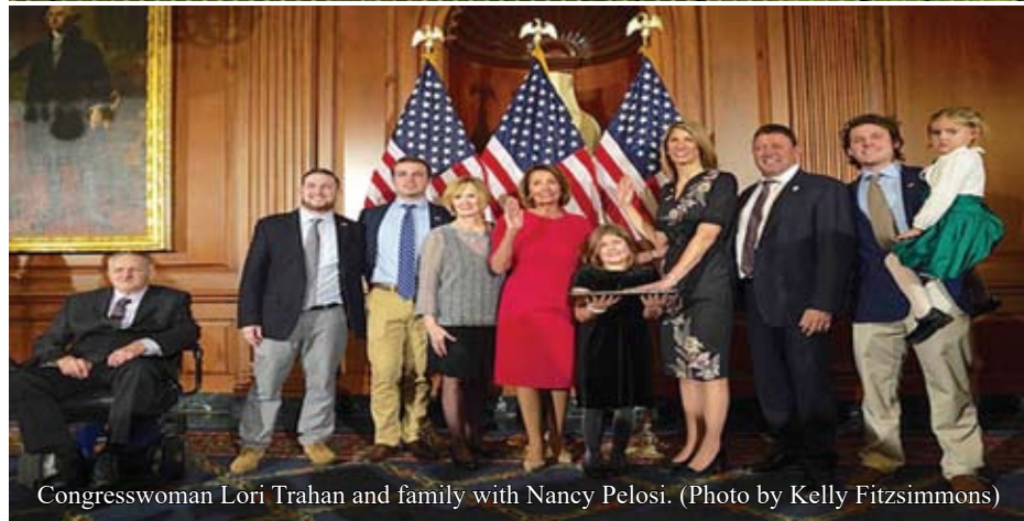
Congresswoman Lori Trahan and family with Nancy Pelosi.