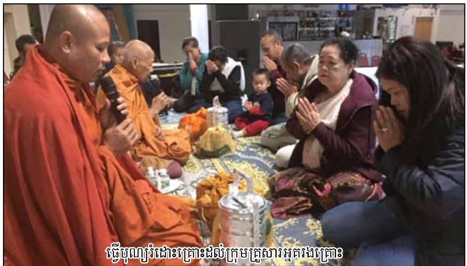
ធ្វើបុណ្យរំលឹកសង្គ្រោះដល់ក្រុមគ្រួសារអ្នករងគ្រោះ

សម្រាប់ក្នុងផ្ទះថា "លោកអ្នកត្រូវធានាថា មានប្រដាប់ប្រាប់ពីអគ្គិភ័យផ្ដើម ជាពិសេសប្រដាប់ចាប់ផ្ដើមភ្លើងថាប្រដាប់ទាំងនោះនៅដើរជានិច្ច - ត្រូវមានផែនការសម្រាប់ឱ្យក្រុមគ្រួសារអ្នករងគ្រោះនៅពេលមានអគ្គិភ័យកើតឡើង - ត្រូវត្រៀម