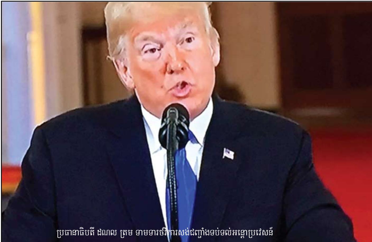
ប្រធានាធិបតី ដណែល ត្រាម ទាមទារថាការសង់ជញ្ជាំងទប់ទល់អន្តោប្រវេសន៍

២ឆ្នាំចុងក្រោយនេះ លោកប្រធានាធិបតីបាន បណ្តេញចេញពីតំណែង បុគ្គលិកធ្វើការឱ្យលោក ចំនួន៤៥រូបហើយ គឺមានអ្នកមានឋានៈជាជនរុក្ខ រំលោភ មាន២៨នាក់ជាសមាជិកការិយាល័យសេដ្ឋ វិមានរបស់លោកមាន១០រូបជាភ្នាក់ងារ ឬក៏ជារដ្ឋ បាលរបស់សហព័ន្ធ...គឺជាកកទុកម្តងឆ្នើមលើស តេ របស់រដ្ឋបាលលោកប្រធានាធិបតីបច្ចុប្បន្ន ។