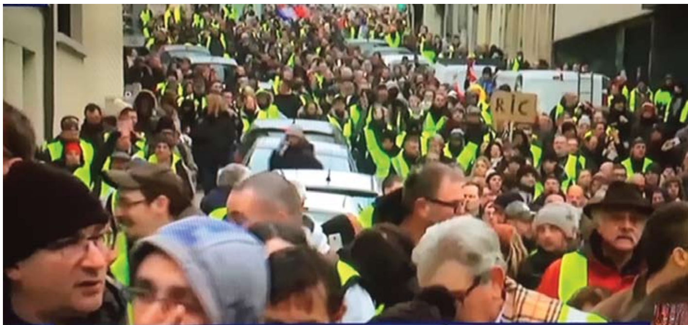
បាតុករអាវលឿងផ្តើមសកម្មភាពសារជាថ្មី (រូបថតកាលពីមុនឱកាសចូលឆ្នាំ)

ឬក៏បំបែកនិងអន្តោប្រវេសន៍ "មជ្ឈិមបូព៌ា" មិន