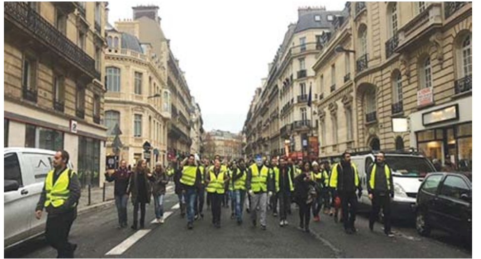
បាតុករអាវល្បឿងផ្ដើមសកម្មភាពសារជាថ្មីបន្ទាប់ពីចូលឆ្នាំថ្មី

ដោយ ពិន សំខុន ដោយសារតែនៅប្រទេសបារាំង មានសហ-