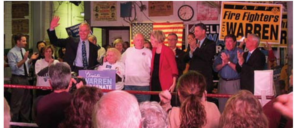
Elizabeth Warren rally at Ramalho's West End Gym, Nov 2012

shot at securing the nomination and being elected president. Too often, we consider presidential elections in the abstract and match the person we know up against some notional concept of who or what a president should be. But that ignores the reality of past presidential elections. On rare occasions, you find someone who you believe would be an outstanding president; I'm thinking Ronald Reagan in 1980 and 1984 for Republicans and Barack Obama