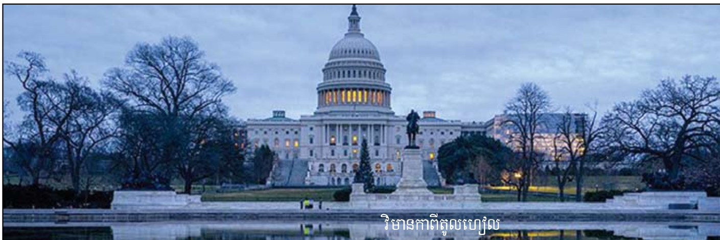
វិមានភាពិភូលហ្សឺល

ចុងក្រោយបង្អស់នៃឆ្នាំទី២របស់លោក គឺឧត្តម សេនីយប្រមុខវិមានឆកាន-Pantagone ជិម ម៉ាទីស ក៏បានលើកត្រូវទងចាកចេញពីដំណែង ចោលលោកត្រាមឡើង ដោយសារលោកប្រធានា