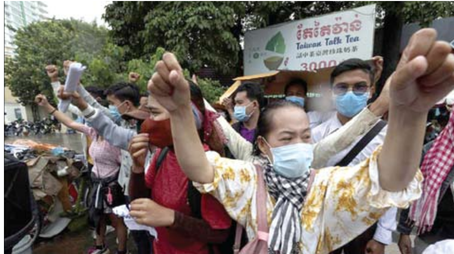
Supporters of Rong Chhun, president of the Cambodian Confederation of Unions, shout slogans in front of Phnom Penh Municipal Court in Phnom Penh, Cambodia on Saturday, August 1, 2020.

cle 9 states that officials must send a positive response to the notification unless the protest would fall on a major national holiday or “there is clear information indicating that the demonstration may cause danger or may seriously jeopardize security, safety