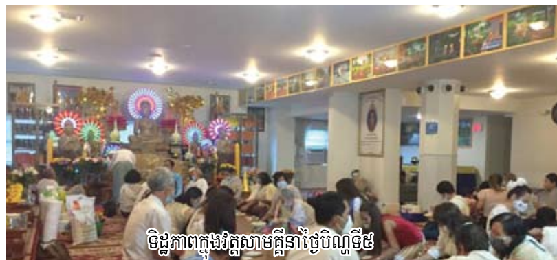
ទិដ្ឋភាពក្នុងវត្តសាមគ្គីនាថ្ងៃបិណ្ឌទី៥

បញ្ចប់កាលពី៣-៤ឆ្នាំមុន ដោយការចាកចេញ របស់វត្តក្រោមទៅបង្កើតវត្ត“សាមគ្គី...” និង បន្ទាប់ពីព្រះគ្រូ សៅ យន ចៅអធិការវត្តព្រៃ រតនារាមដំបូងគេ ក៏បានដកខ្លួនចាកចេញមុន គេកាលពី៥-៦ឆ្នាំមុន ទៅរកបង្កើតវត្តមួយនៅ