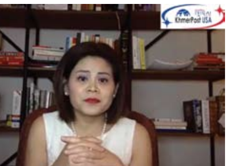
សុបិន ពិន កាសែតខ្មែរប៉ុស្តិ៍

ដីខ្មែរដើម្បីដឹងគុណយួន ដែលនេះជារឿងធម្មតារបស់មេដឹកនាំមួយចំនួននៅលើពិភពលោកដែលជំពាក់គុណបរទេស ។ លោកលើកឡើងថាការចោទគឺមិនហ៊ានធ្វើការតវ៉ាអ្វីនោះទេដោយសារទេយួនជាថៅវាយ ។ ទាក់ទងទៅនឹងព្រំដែនសមុទ្រវិញខ្ញុំសង្កេតឃើញថាថែ និងវៀតណាមបានយកដែនសមុទ្រជាប់ប្រទេសកម្ពុជាជារបស់ខ្លួនញឹកញាប់ក្នុងកម្ពុជាពេលចង់ចេញ