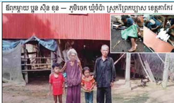
ឪពុកម្តាយ ប្អូន ស៊ិន ខុន — ភូមិចេក ឃុំចំប៉ា ស្រុកព្រៃកប្បាស ខេត្តតាកែវ