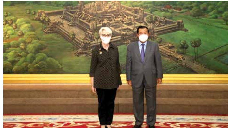
សម្តេច ហ៊ុន សែន និងអ្នកស្រី វីនឌី ស៊ីមេន អនុរដ្ឋមន្ត្រីក្រសួងការបរទេស

ស៊ីមេន បានគូសបញ្ជាក់ពីការគាំទ្ររបស់សហរដ្ឋ អាមេរិកសម្រាប់ប្រទេសកម្ពុជាក្នុងអំឡុងពេលជំងឺរាតត្បាតរួមទាំង ថវិកា