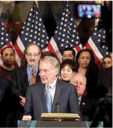
អែដ ម៉ាលី សភាអធិបតីនៃក្រុមប្រឹក្សាសហប្រតិបត្តិការអាស៊ាន

tional election that had led the ruling party to winning all seats.