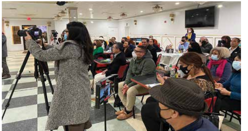
Cambodian American community meeting 3/3/2022 Olympic Restaurant, Lowell, MA

The United States Congress passed the Cambodia Democracy Act of 2021 and Cambodia Trade Act of 2019 in attempt to put pressure the Cambodia government to open civic and political space through economic sanctions. The bill has been in-