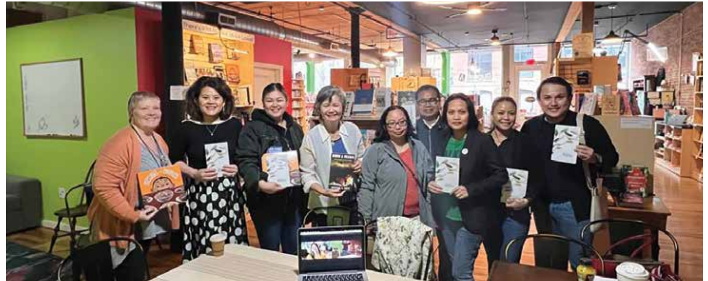
បង្ហាញសៀវភៅខ្មែរនៅLala Books

Going around the table, everyone took their turn to speak. Remembering their journey to America, everyone had a story to tell. After the reign of the Khmer Rouge terror, hundreds of thousands Cam-