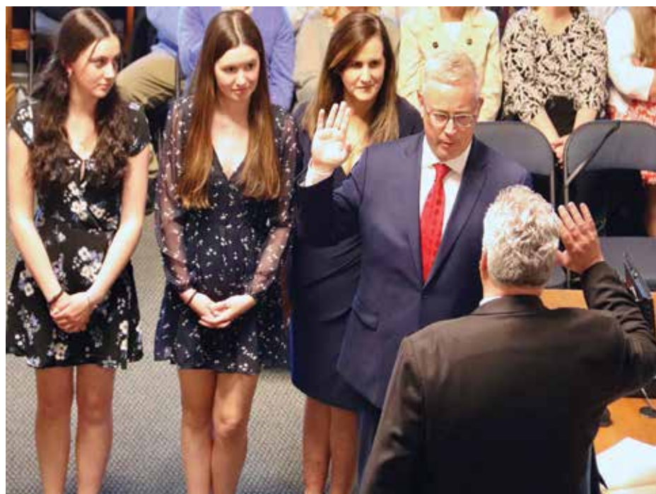
ឈរក្បែរ Golden ក្នុងពិធីស្បថចូលកាន់តំណែង គឺភរិយារបស់លោក Joane Sheehan Golden និងកូនស្រីពីរនាក់

ទីក្រុងឡូវែល រដ្ឋម៉ាសាឈូសេត - តំណាងរាស្ត្ររដ្ឋដ៏យូរអង្វែង Tom Golden បានស្បថចូលកាន់តំណែងជា អ្នកគ្រប់គ្រងទីក្រុងបន្ទាប់កាលពីយប់មិញ។ តំណាងរាស្ត្រ Golden បានបម្រើការនៅ សង្កាត់ Middlesex ទី១៦ ដែលរួមមាន Centralville, Pawtucketville និង North Chelmsford តាំងពីឆ្នាំ ១៩៩៤។ គាត់ បានកាន់តំណែងជាអ្នកដឹកនាំជាច្រើន រួមទាំងជាប្រធានគណៈកម្មាធិការសភា ទទួលបន្ទុកផ្នែកទូរគមនាគមន៍ ថាមពល និងសម្ភារៈ។