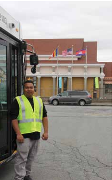
Muon posed by a bus which parked at the front of LRTA office, across the street from Glory Buddhist Temple in Lowell

“Currently, there are two openings for bus drivers. We want to inform people that LRTA’s doors are open to the Asian community. People with commercial driver license are encouraged to apply,” said Annastas. For more information, visit www.lрта.com