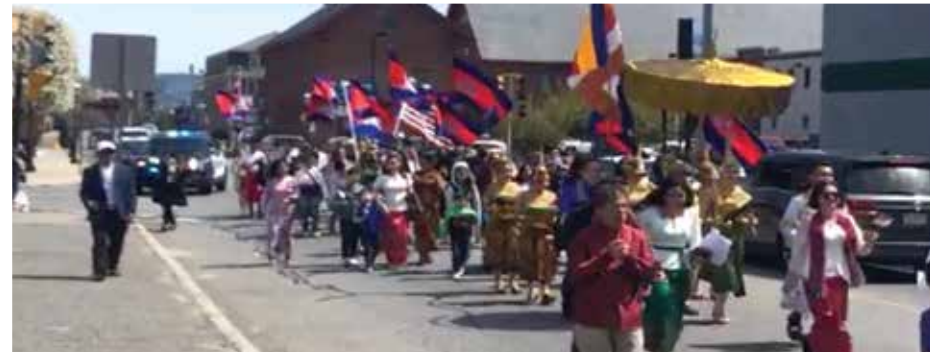
Khmer New Year parade in Lowell

Park បានបន្តការប្រារព្ធពិធីចូលឆ្នាំថ្មីប្រពៃណីជាតិខ្មែរលើកទី ១២ ឡើងវិញ ការប្រារព្ធពិធីក៏បានធ្វើឡើងនៅមជ្ឈមណ្ឌល Lowell Senior Center និងនៅសាលាក្រុងឡូវែល មានពិធីលើកទង់ជាតិ ត្រូវបាន