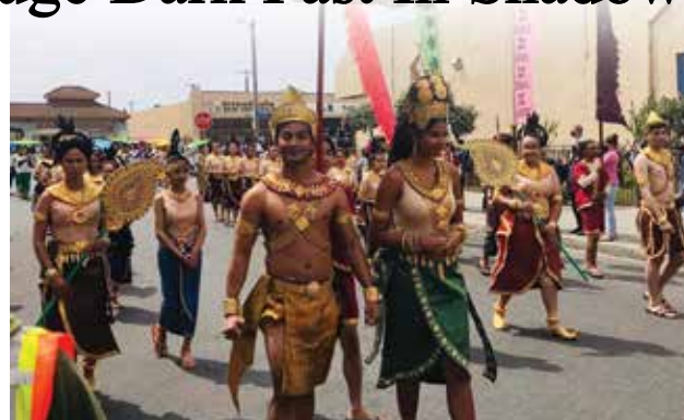
Cambodian New Year Parade in Long Beach, CA

Cambodians celebrate the New Year on April 13 – 15, the three days of celebration is a tradi- tion more than 5,000 years old. Cambodians share this holiday at the