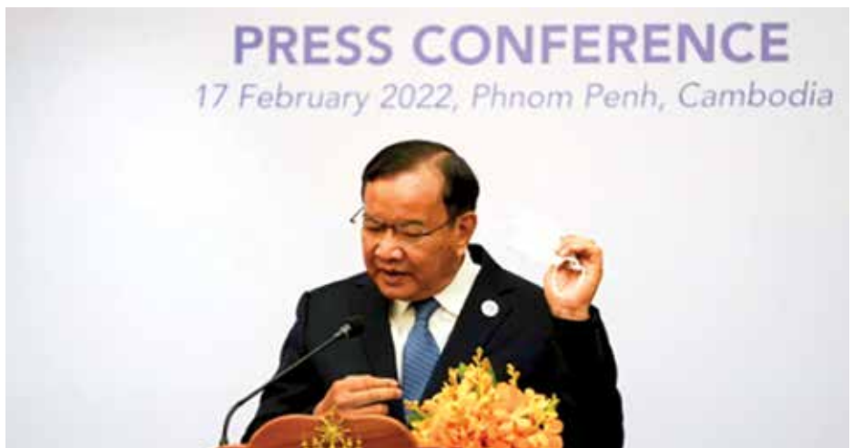
Cambodia's Foreign Minister Prak Sokhonn removes his mask before the news conference after the ASEAN foreign ministers' meeting in Phnom Penh, Cambodia, on February 17, 2022.