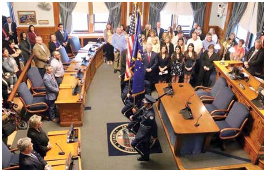
កម្មវិធីស្តាប់ចូលកាន់តំណែងរបស់ចៅហ្វាយក្រុងថ្មីឡូវែល

កិច្ចប្រជុំលើកដំបូងរបស់ Golden ជាមួយសមាជិកក្រុមប្រឹក្សាក្រុងនឹងធ្វើឡើងនៅថ្ងៃទី ៣ ខែឧសភា ឆ្នាំ២០២២។ កាសែតខ្មែរប៉ុស្តិ៍សហរដ្ឋអាមេរិកទទួលបានរបៀបវារៈ និងចំណុចពិរដែលចាប់អារម្មណ៍ចំពោះសហគមន៍កម្ពុជាគឺរបៀបវារៈលេខ ៨.៥ “ក្រុមប្រឹក្សា នួននិងក្រុមប្រឹក្សា យ៉ែម ស្នើសុំក្រុមប្រឹក្សាក្រុងទទួលស្គាល់ថ្ងៃទី ១៧ ខែមេសា ជា