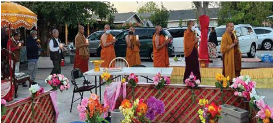
Khmer Killing Field Memorial Service in Long Beach, April 17, 2022