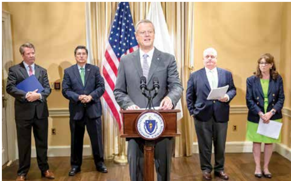
Massachusetts Governor Charlie Baker

បទបញ្ជាប្រតិបត្តិដែលបានចុះហត្ថលេខានៅថ្ងៃនេះ ដែលនឹងធ្វើឱ្យបុគ្គលិកថ្នាក់កណ្តាលខ្លះខ្មែងលើកកម្ពស់សមធម៌នៅ SDO និងពង្រឹងកិច្ចខិតខំប្រឹងប្រែងរបស់ខ្លួនដើម្បីគាំទ្រដល់សហគមន៍អាជីវកម្មចម្រុះ”។ បទបញ្ជាប្រតិបត្តិថ្មីរួមបញ្ចូល