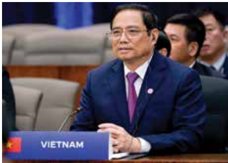
Vietnamese Prime Minister Pham Minh Chinh participates in the U.S.-ASEAN Special Summit to commemorate 45 years of U.S.-ASEAN relations at the State Department in Washington, on May 13, 2022.

We laud the U.S.-ASEAN Special Summit recently held in Washington and believe this is an achievement of the Biden administration that may usher in a “new era” in relations between our country and the 10-member Association of Southeast Asian Nations (ASEAN) as part of the U.S. Indo-Pacific Strategy to counter China’s aggression in the region. The summit agenda included a Please see /05