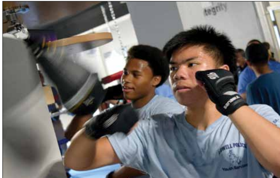
Two youth boxers test out brand new speed bags in the new youth boxing facility.

For more information on joining the Youth Boxing Club, email: LPDYouthServices@lowellma.gov.