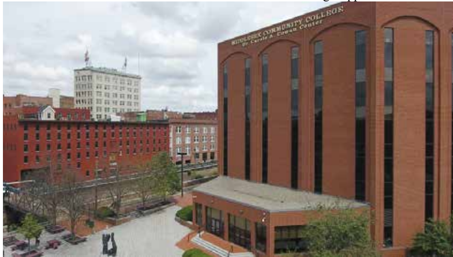
MCC Lowell Campus

នាក់នឹងចូលរួមក្នុងវគ្គបណ្តុះបណ្តាលដោយឥតគិតថ្លៃ នេះបើយោងតាមការចេញផ្សាយរបស់អភិបាលក្រុងមហាវិទ្យាល័យសហគមន៍នីមួយៗនឹងត្រូវបានផ្តល់មូលនិធិដើម្បីបម្រើបុគ្គលចំនួន ៧៥ នាក់។ បុគ្គលដែលអត់ការងារធ្វើ ឬរកការងារធ្វើមិនបាននឹងមាន អាទិភាព។ មូលនិធិបន្ថែមនឹងត្រូវបានផ្តល់ជូនដោយផ្អែកលើតម្រូវការចុះឈ្មោះ។