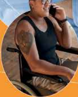
ខ្ញុំគឺជាម្ចាស់អាជីវកម្ម