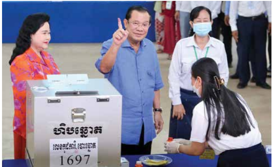
សម្តេច ហ៊ុន សែន ចូលរួមបោះឆ្នោតក្រុមប្រឹក្សាឃុំសង្កាត់

គណៈកម្មាធិការជាតិរៀបចំការបោះឆ្នោតបានបញ្ចប់ការបោះឆ្នោតឃុំសង្កាត់នាខែមិថុនា នៅពេលដែលខ្លួនបានប្រកាសលទ្ធផលចុងក្រោយកាលពីថ្ងៃអាទិត្យដោយបញ្ជាក់ពីការកាន់កាប់របស់ CPP លើអាសនៈក្រុមប្រឹក្សាចំនួន ៩៣៧៦