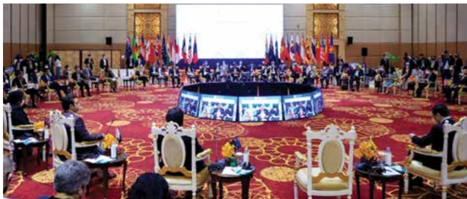
The ASEAN Foreign Ministers Meeting in Phnom Penh, Cambodia, Aug. 5, 2022.

លោករដ្ឋមន្ត្រី ក៏បានជំរុញឱ្យ លោកនាយករដ្ឋមន្ត្រីបើកលំហពលរដ្ឋ និងនយោបាយឡើងវិញនៅមុនការបោះឆ្នោត