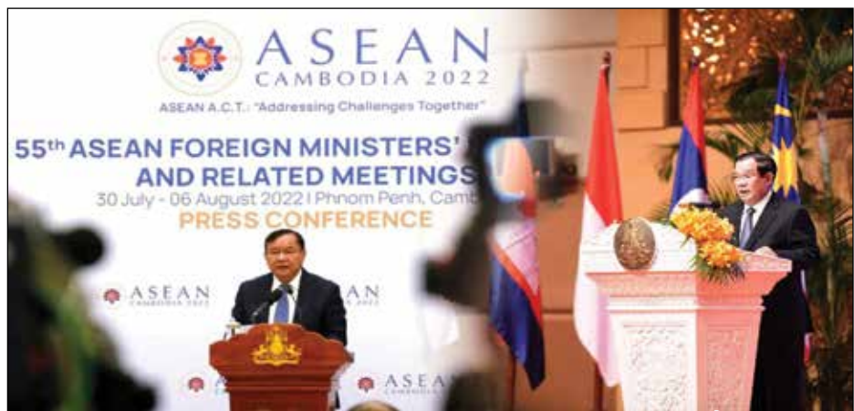
សម្តេច ហ៊ុន សែន