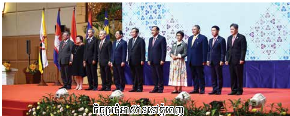
កិច្ចប្រជុំអាស៊ាននៅភ្នំពេញ

កម្ពុជាទាំងអស់ រួមទាំងលោក កឹម សុខា សហប្រធានគណបក្សប្រឆាំងធំគឺគណបក្ស សង្គ្រោះជាតិ (CNRP) ដែលត្រូវបាន ចោទប្រកាន់ពីបទក្បត់ជាតិនៅឆ្នាំ២០១៧ អាចចូលរួមដោយសេរីក្នុងដំណើរការ នយោបាយ។