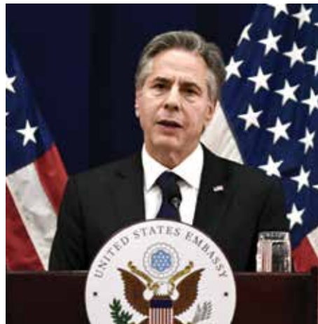
Secretary of State Antony Blinken

August 5, 2022 – U.S. Secretary of State Antony Blinken attended the 55th ASEAN Foreign Ministers' Meeting in