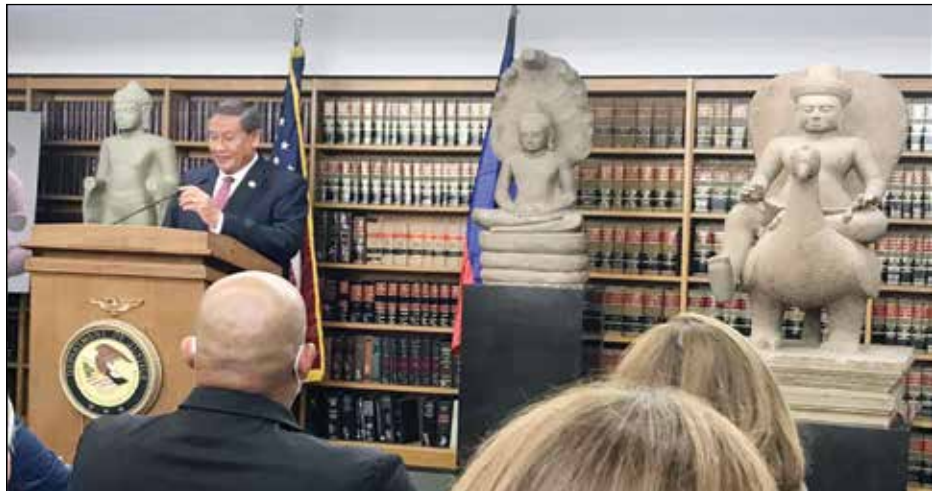
វត្ថុបុរាណចំនួន៣០ដែលបញ្ជូនមកកម្ពុជាវិញ

ប្រទេសកម្ពុជានិស្ស ខ្មែរក្រហមបាន កម្ចាត់ លន់ នល់ នៅឆ្នាំ១៩៧៥ ហើយ បានកាន់កាប់អំណាចរយៈពេល ៤ ឆ្នាំ និងត្រូវបានចាញ់នៅឆ្នាំ១៩៧៩ដោយសារ ឈ្លានពាន និងការកាន់កាប់លើកទីពីរ របស់វៀតណាម ដែលបន្តរហូតដល់កិច្ច ព្រមព្រៀងសន្តិភាពទីក្រុងប៉ារីស ឆ្នាំ ១៩៩១ ។