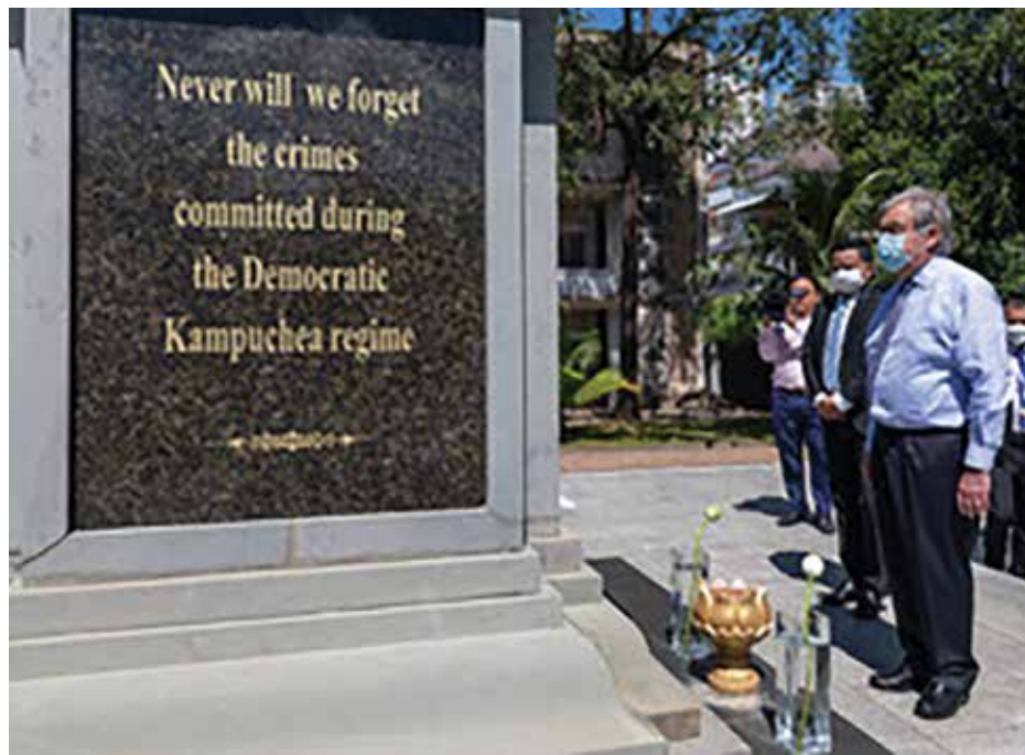
UN Secretary-General Antonio Guterres

របស់ពួកគេ។ វាជាការចាំបាច់ដែលការចងចាំនូវអ្វីដែលបានកើតឡើងនៅទីនេះមិនបាត់បង់ឡើយ”។