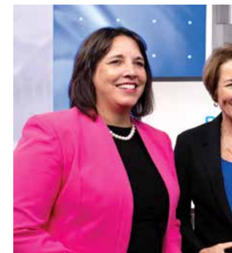
Lieutenant Governor Elect Kim Driscoll

នៅក្នុងខែវិច្ឆិកា អ្នកបោះឆ្នោតនៃរដ្ឋម៉ាសាឈូសេត បានជ្រើសរើស