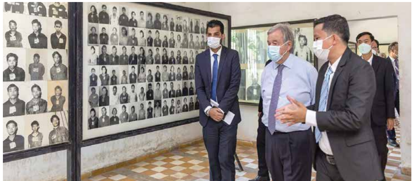
Nick Sells UN Secretary-General António Guterres views a wall of photographs of prisoners of the Khmer Rouge regime in one of the rooms of Tuol Sleng Genocide Museum, the site of the infamous Security Prison S-21 in Phnom Penh, Cambodia.