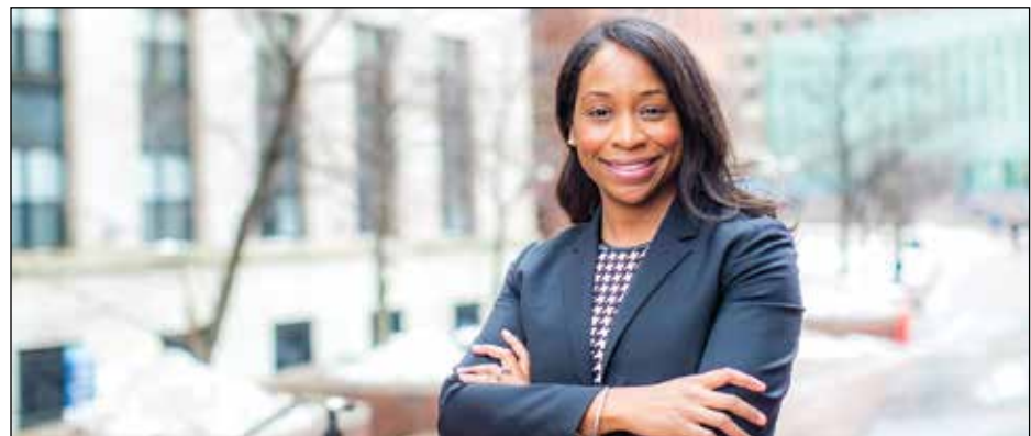
Attorney General Elect Andrea Campbell

លើបញ្ហាទាំងពីរក៏ដោយ ក៏មិនមានដំណោះស្រាយច្បាស់លាស់ណាមួយត្រូវបានគេកំណត់ ដែលធានាថាពួកគេនឹងបន្តជាបញ្ហាប្រឈមផ្នែកសារពើពន្ធនៅឆ្នាំ ២០២៣ និងលើសពីនេះ។