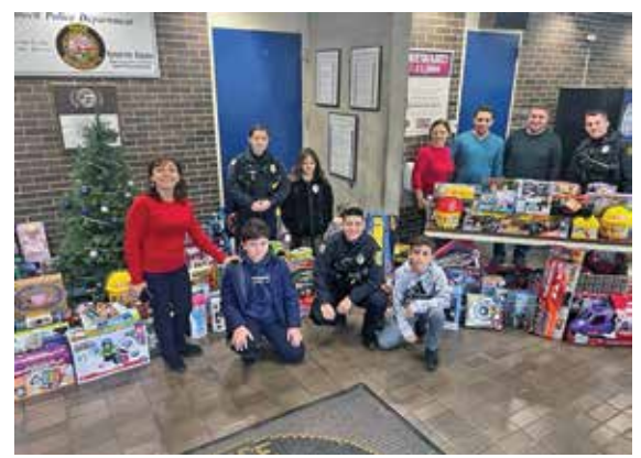
Team members from United Dental of Lowell deliver toys to the police station for the 8th annual Lowell Police Holiday Toy Drive. (Courtesy Lowell Police Department)

New, unused and unwrapped toys and gifts donated by individual donors and community partners include clothing,